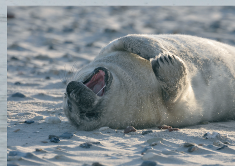
4 Junge Kegelrobbe

Kegelrobbenbabies kommen im Winter zur Welt, Seehunde werden im Sommer geboren. Trotzdem brauchen beide eine dicke Speckschicht, um im Wasser nicht auszukühlen. Die Milch der Muttertiere hat ca. 50% Fettanteil, damit kann ein Jungtier schnell Gewicht gewinnen. Auch für den Zeitraum, in dem sie lernen, selbst erfolgreich zu jagen, brauchen sie eine Reserve. Neugeborene Schweinswale werden ebenfalls gesäugt. Das erledigen Mutter und Kalb allerdings unter Wasser und nicht wie Seehunde und Kegelrobben auf der Sandbank oder am Strand.